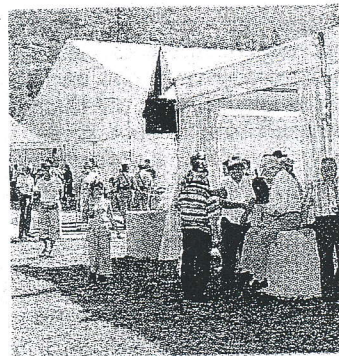
La «Rencontre» del 2007