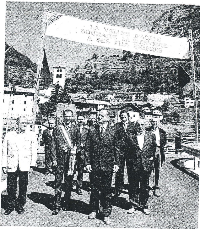
Le président Augusto Rollandin et le syndic Claudio Restano

Dimanche passée, le 10 août, plus de 700 personnes a Valpelline pour la fête dédiée aux valdôtains émigrés