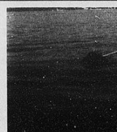
Un cane Terranova impegnato in una prova di salvataggio

Brusson: alle 20,30 nel salone delle manifestazioni di saggi del piccolo coro «Musica en fuor». Alle 21,15 spettacolo con il duo «Rouge et noir». Cervinina: festa della Madonna delle nevi alle 10,30, con messa nella chiesetta. Dalle 15,30 gara di monopattino lungo le strade del centro. Champdepraz: alle 21 serata danzante con l'orchestra «Orient Express». Châtillon: sulla piazza del mercato torneo di calcio saponato, iscrizioni entro le 15. Cogne: alle 21 s'inaugura, nella «Maison de la Grivola», la