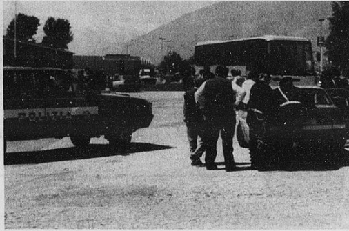
Pattuglie della Polstrada. Il sindacato Coisp chiede strutture adeguate per l'accoglienza dei clandestini

trattenuto negli uffici di appartenenza degli agenti, qualora venga rintracciato in giornata e orari di chiusura dell'ufficio. Stranieri e anche quando non sia disponibile il residente della giunta per la firma del decreto di espulsione. Ad Aosta l'emergenza stranieri si combatte così? Ci domandiamo se i cittadini siano informati della situazione attuale e se siano a conoscenza che per una semplice notifica di un provvedimento di espulsione, vengano privati dei servizi di pattugliamento, già precari per assoluta emergenza in fatto di organici. Ci chiediamo se non sia ora di organizzarsi in modo diverso per trattare gli stranieri irregolari, creando subito un centro di permanenza temporanea, senza togliere al cittadino i normali servizi di pattugliamento soltanto per tempo, non può andare tranquillamente in giro per poi ripresentarsi al 16° giorno per essere espulso. Ma chi ci crede?». [s. ser.]