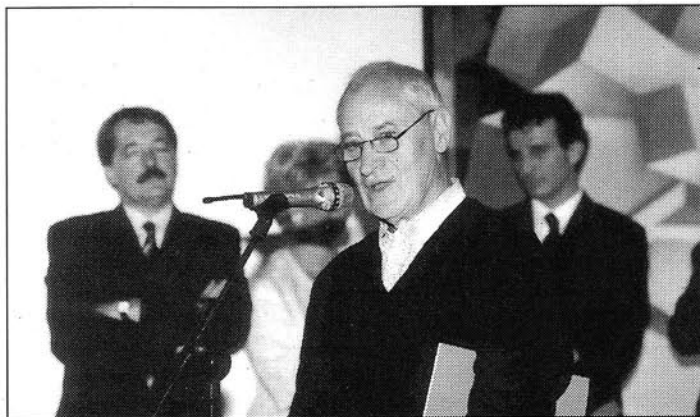
Giò Pomodoro parle à l'inauguration de l'exposition.