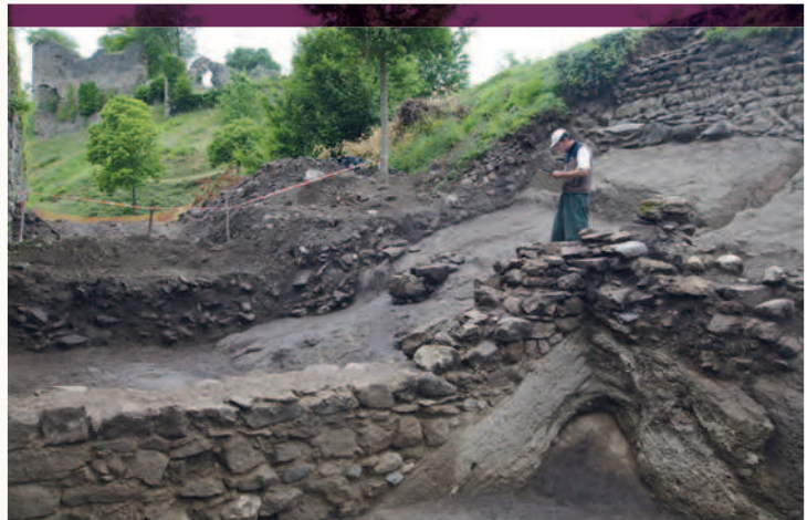
Château-Vieux d'Allinges (Haute-Savoie, Francia). Rilievo archeologico tradizionale al termine delle attività di scavo.

Le propre d'un mortier trop liquide est de se retirer et de devenir excessivement dur une fois sec.