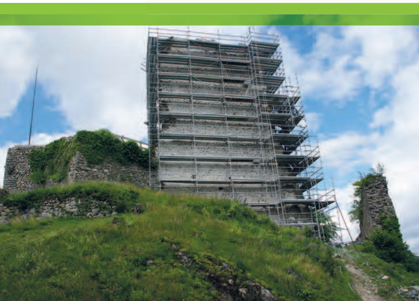
Château-Vieux d'Allinges (Haute-Savoie, Francia). I ponteggi per i restauri avvolgono il muro difensivo del castello.

Le maestranze formate, o inserite, in ambito edile tendono, generalmente, ad eseguire una data opera nel minor tempo possibile, secondo la corrente logica di impresa, che vuole abbattere i propri costi riducendo i tempi di lavorazione. Ciò, anche se non auspicabile, potrebbe essere accettabile, in relazione a determinati lavori. Più allarmante è l'impiego, ormai sistematico, di prodotti di basso costo e di bassa qualità (cemento, malte premiscelate) e di procedure approssimative di messa in opera. Nella prassi comune, la preparazione e la messa in opera di malte e intonaci è caratterizzata da abitudini negative qui di seguito riassunte.