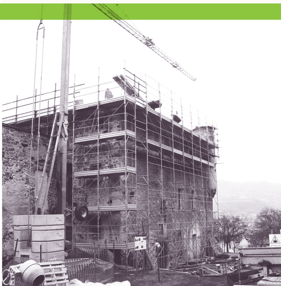
Casaforte di Saint-Marcel (Valle d'Aosta, Italia). Cantiere per la manutenzione del tetto.

All'impresa esecutrice si richiede di conseguenza l'uso di malte di calce idrata ed idraulica naturale (norme NHL), formulate a seguito di campionature da sottoporre all'approvazione delle D.L. e D.S. e a regolari controlli di qualità.