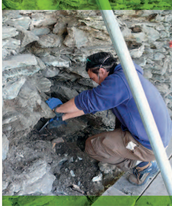
Castello di Graines (Valle d'Aosta, Italia). Operazioni di pulitura della scarpa.