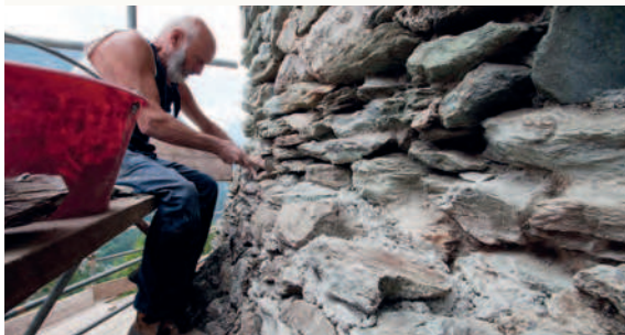
Castello di Graines (Valle d'Aosta, Italia). Integrazione della parte sommitale della scarpa.

Sui rilievi grafici (in pianta e sezioni dell'elevato), verranno trasposte le osservazioni archeologiche, le informazioni relative allo stato di conservazione, alla presenza di lacune o crolli, a situazioni di potenziale pericolo (cedimenti, sfornellature, fessure, lacune ecc.).