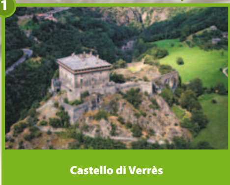
Castello di Verrès