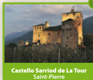
Castello Sarriod de La Tour Saint-Pierre