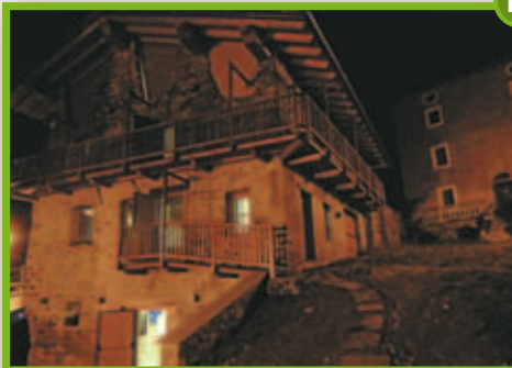
Maison des Anciens Remèdes Jovençon