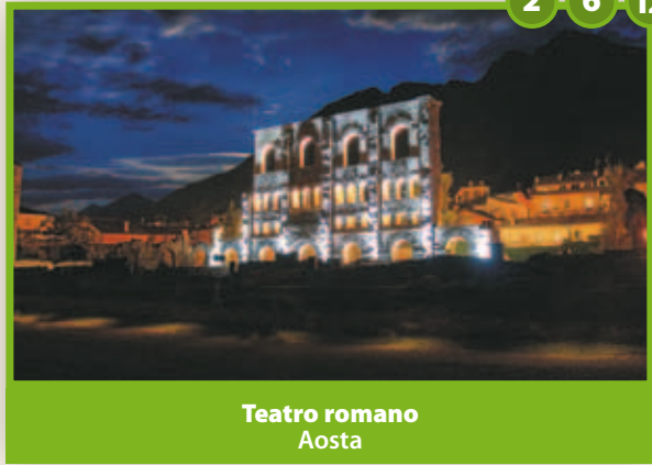
Teatro romano Aosta