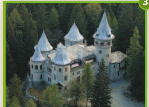
Castel Savoia Gressoney-Saint-Jean