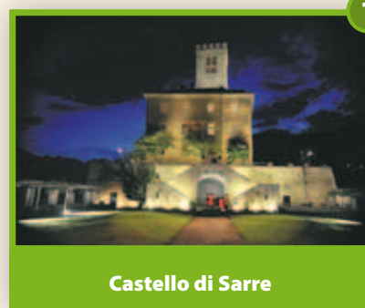
Castello di Sarre