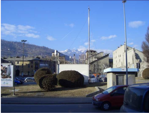
Aosta Piazza Plouves