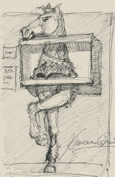
Schizzo per lo studio della scenografia