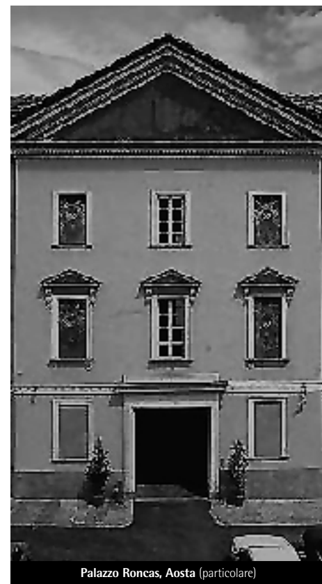
Palazzo Roncas, Aosta (particolare)