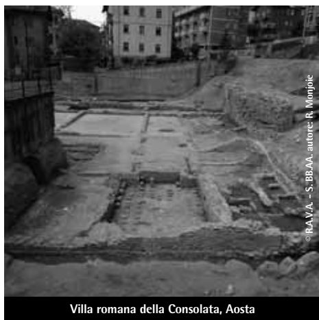
Villa romana della Consolata, Aosta