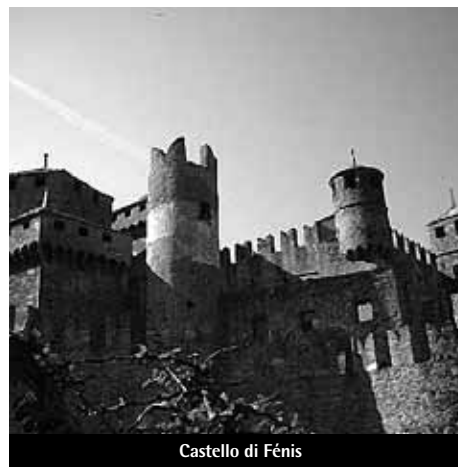
Castello di Fénis