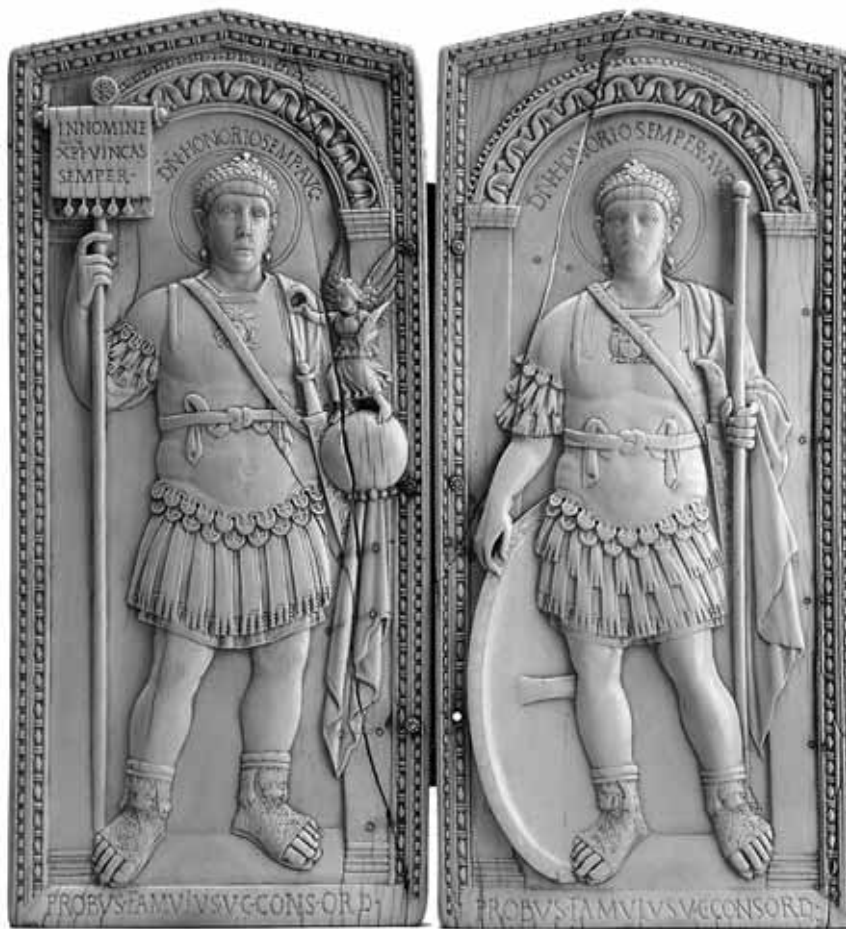
Il dittico al termine del restauro

o XVI secolo. Esso era consistito nell'inserimento della cerniera in argento che ancora oggi unisce le due tavolette e nella ricomposizione approssimativa delle fratture, eseguita utilizzando un cordoncino, anch'esso d'argento, inserito in 34 fori praticati per l'occasione.