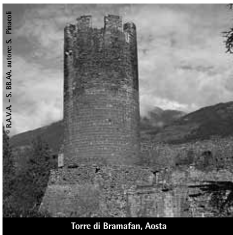
Torre di Bramafan, Aosta