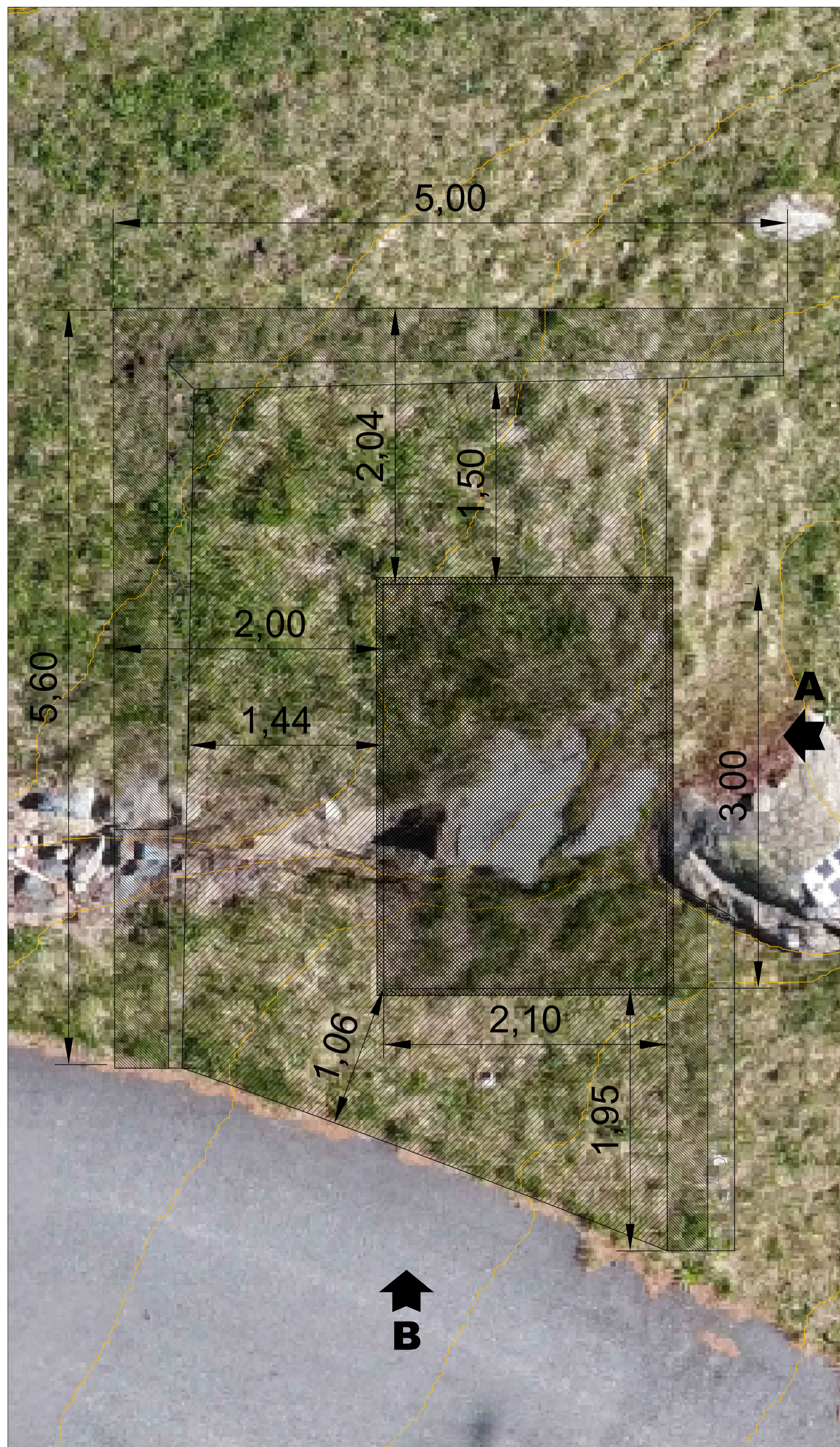
PIANTA - scala 1:25